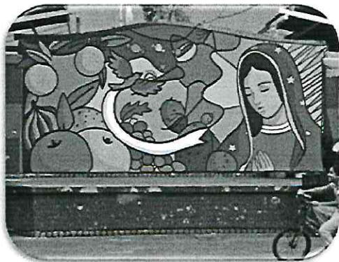
Foto: Explanada del Mercado 23 de abril, Colonia San Pedro Xalpa

Es una iniciativa emprendida que busca promover la cultura de la paz a través de talleres y pintura mural en las unidades territoriales que se encuentran en los polígonos con alta incidencia de violencia, creando espacios de reflexión sobre la generación de comunidad con un enfoque de promoción de los derechos humanos, a través de un espacio público intervenido por la misma ciudadanía, que le invita a cuidarlo, disfrutarlo y vivirlo.